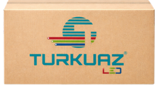
Ürün Kolisi (Product Boxes) 100 Adet Rulo (500m) 56x33x25cm