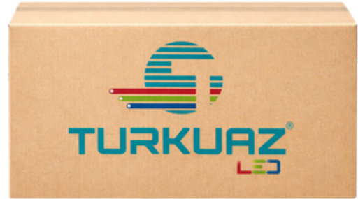
Ürün Kolisi (Product Boxes) 100 Adet Rulo (500m) 56x33x25cm